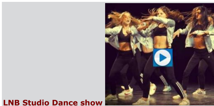
LNB Studio Dance show

découvrir les techniques picturales utilisées par les amateurs. Gratuit, infos 04 66 50 50 56